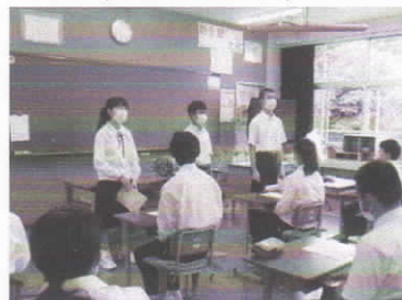
【本部役員による生徒会入会式】

保護者の皆様、大変お忙しい中、また酷暑の中になるとは思いますが、このような計画としました。まだ1学期が始まったばかりですが、学校の考えを早めにお伝えしたく、このタイミングでのご連絡としました。よろしく願いいたします。